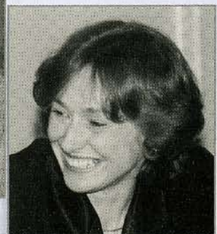
НАДЕЖДА КОСАРЕВА Президент Фонда "Институт экономики города"